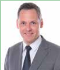
UNICEF 東京事務所 代表 ロベルト・ペネス

毎年このような素晴らしい地球環境世界児童画コンテストを開催されている、国際認証機関ネットワークと一般財団法人日本品質保証機構の皆様、UNICEF（国連児童基金）を代表して心よりお礼を申し上げます。